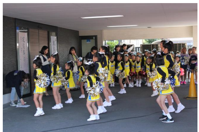
隣の円満院さんでは、小音で直前練習可能です