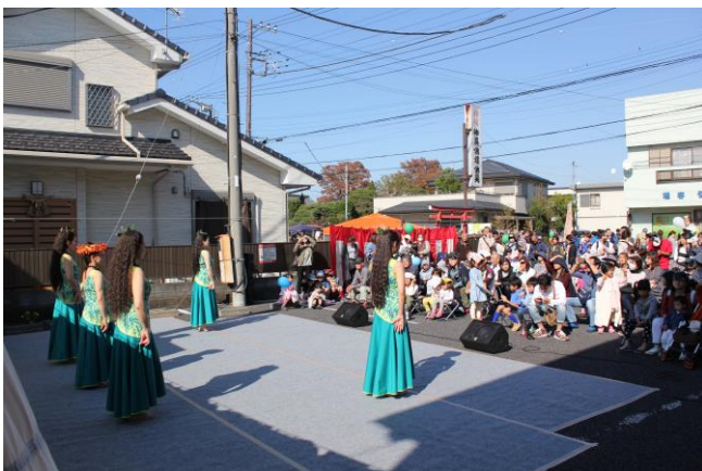
ステージ裏（横？）から見るとこうなります